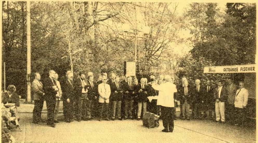
Die Sänger aus Quirrenbach und Hanfmühle beim Maiansingen auf dem Eudenbacher Marktplatz

Die Vereine der ganzen Region haben sich zusammen gefunden um von sich und ihren Aktivitäten zu berichten. Das ist sehr lobenswert, denn der Bürger braucht diese Information. Die Menschen haben immer kürzere Arbeitszeiten und damit auch mehr Freizeit. Aber, wohin damit? Warum nicht einen Beitritt in einen der zahlreichen Vereine? Lesen Sie diese Zeitschrift und die Wahl welcher Verein Ihr zukünftiger sein wird, fällt Ihnen leichter.